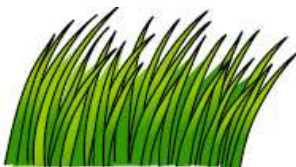
GRASS (de l'herbe)

Entraîne-toi à reconnaître ces mots quand tu les entends dans l'histoire :