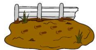
MUD (de la boue)