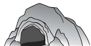
A CAVE (une grotte)