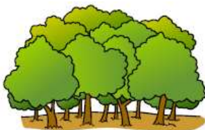
A FOREST (une forêt)